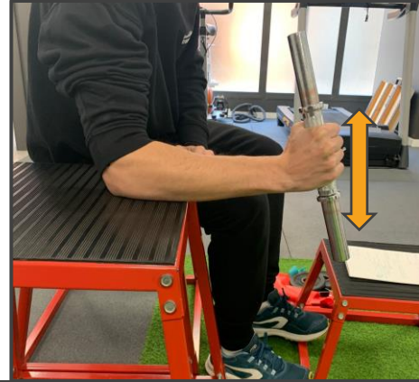
MARTILLO DE MUÑECA Subir y bajar con la muñeca 3 x 15