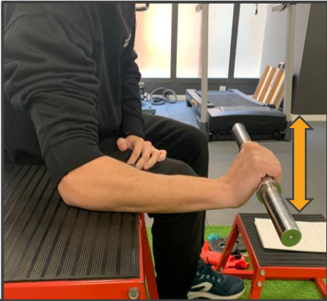
EXTENSIÓN DE MUÑECA Subir y bajar con la muñeca 3 x 15