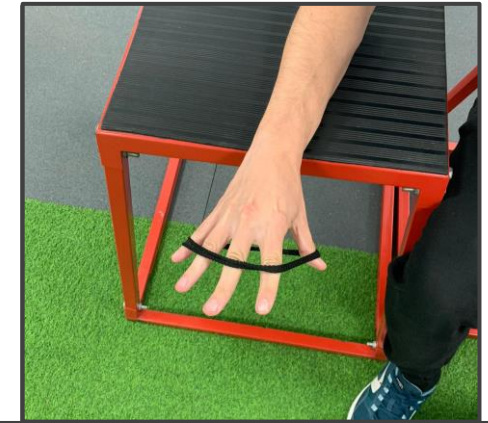
EXTENSIÓN DE DEDOS Abrir y cerrar los dedos 3 x 15