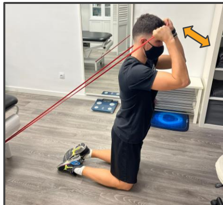
PATADA TRÍCEPS Extender codos y volver lento 3 x 15