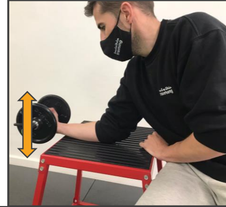
FLEXIÓN DE MUÑECA Subir y bajar con la muñeca 3 x 15