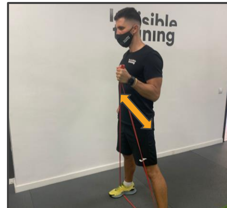
CURL BÍCEPS Flexionar codos y volver lento 3 x 15